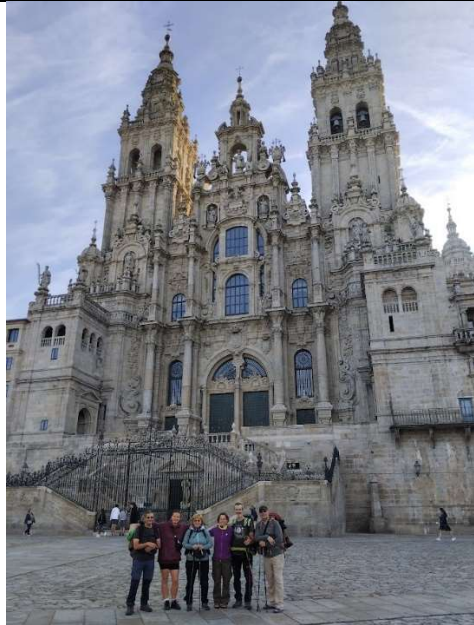
Mezinárodní přátelství v Santiagu

Jedna z věcí, kterou jsem tak trochu nečekala byla, že většina cest byla dlážděná, nebo asfaltová. Téměř všichni nato zoufali a léčili méně či více rozběhlé záněty achilovek. Někdo zase nepočítal, že se mu noha cestou tak rozšlápne a řešil stavy od puchýřů po slezlé nehty na nohou. Rozhodně je dobré volit širokou obuv a alespoň o dvě čísla větší. A ideálně ještě boty do rezervy.