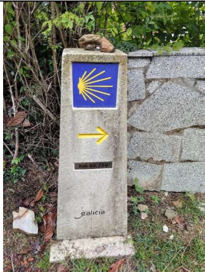
Značení cesty v Galicii

Tradičně se cesta do Santiaga začínala z místa Vašeho bydliště, ale záleží to jen na Vás, kolik máte času a jak dlouhou trasu hodláte ujet nebo ujít. Někdo si trasu naplánuje na několik let a každý rok jde třeba 14 dní, někdo se popoveze blíž a ujede to celé, za jednu dovolenou. Aby byla poutnická cesta splněna dle pravidel a chcete-li na ní certifikát, je potřeba ujít minimálně posledních 100km pěšky (nebo na koni), případně ujet 200km na kole, nebo třeba 100mil na plachetnici a z přístavu to dojít po svých. Každá trasa má svá krásná místa, zajímavou historii i památky. Záleží jen na Vás, kterou si vyberete. Hodně udělá i samotné počasí.