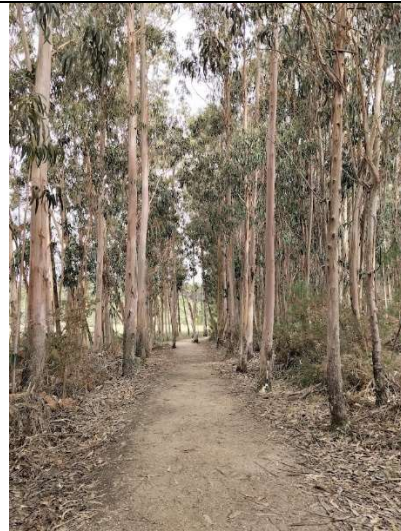
Portugalsko ve znamení eukaliptů

Ubytovat se můžete v ubytovnách pro poutníky anebo si najít svůj hotel, případně místo, kde postavíte stan. Prostě je to na Vás. Já měla stáhnutou aplikaci do telefonu a nechávala si poradit, kde je nejbližší ubytování, jeho cenu, možnosti nákupu atd. V současné době je aplikací docela hodně, záleží jen na Vás, která Vám bude nejvíce vyhovovat nebo prostě půjdete a dojdete tam, „kam Vás nohy donesou“.